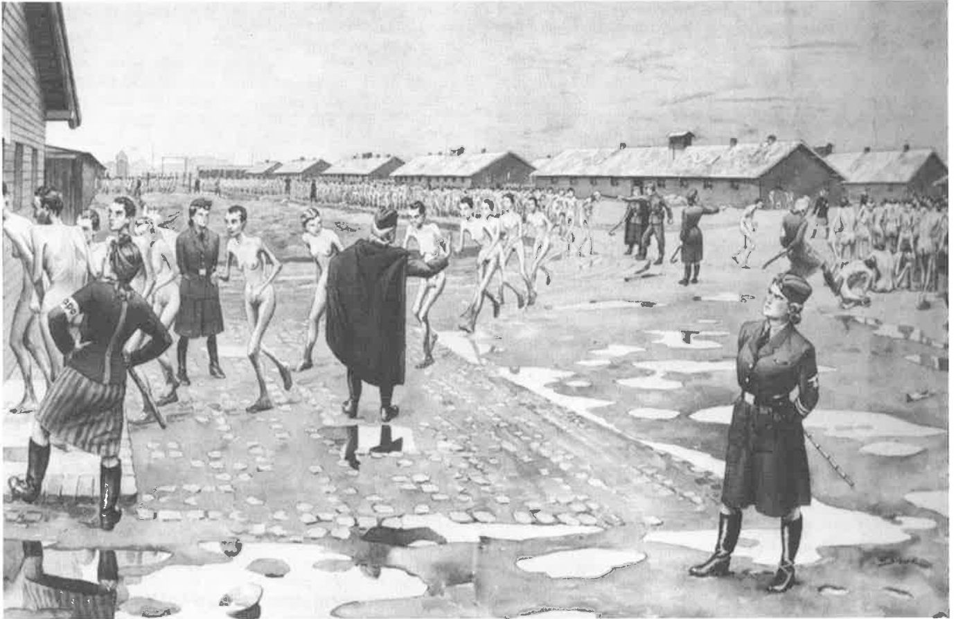
Kampbewaaksters die vrouwen in concentratiekamp Birkenau selecteren voor de gaskamers.

als "die mannen en vrouwen die direct bij de genocide betrokken waren en doelbewust bijdroegen aan de moord op de joden". 5 Omdat hij in zijn definitie van het begrip 'dader' zo duidelijk beide seksen opneemt, rijst de vraag of zijn onderzoek een schakel kan vormen tussen de gevestigde geschiedwetenschap en de gender- en vrouwengeschiedenis.