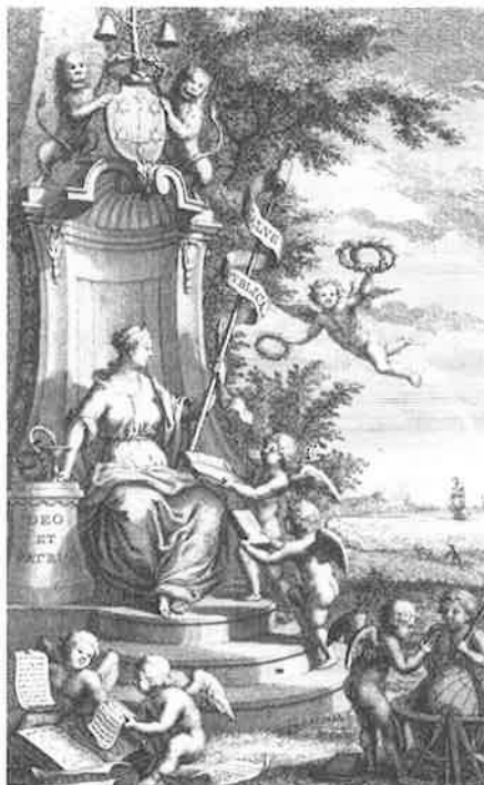
Titelprint en begeleidend gedicht uit het eerste deel van de Verhandelingen , die in 1754 werden uitgegeven door de Hollandsche Maatschappij der Wetenschappen te Haarlem .

De achttiende-eeuwse genootschappen waren overwegend mannenbolwerken; aanvankelijk konden vrouwen geen lid worden en toen het lidmaatschap eenmaal voor hen openstond, werd slechts een enkele vrouw lid. Gaandeweg kregen vrouwen geregelder toegang tot het genootschappelijk leven. Maar er is nog weinig bekend over de relatie tussen vrouwen en genootschappen, omdat hier pas sinds kort meer onderzoek naar wordt gedaan. Daarom wordt op de SVVT-studiemiddag de relatie tussen vrouwen en genootschappen nader aan de orde gesteld om te onderzoeken of het bestaande beeld aangevuld of gedif-