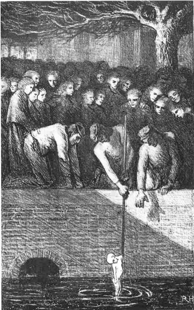
Richard Roland Holst, 'Het riool braakt zijn ellende' (1898). * Oorspronkelijk afgebeeld met een tekst van Herman Heijermans, in: De Sociaal Democraat (1899).