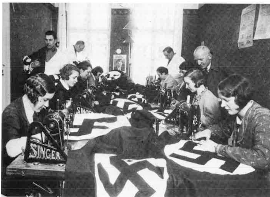
Naaisters van nazi-vlaggen. Berlijn, 1933. Bron: Claudia Koonz, Mothers in the fatherland. Women, the family and Nazi politics (Londen, 1987).

Een goed voorbeeld van een studie die de 'gewone' Duitser centraal stelde, is Hitlers gewillige beulen van Daniel J. Goldhagen in 1996 verscheen. Goldhagen richt zich in zijn onderzoek op de Duitse daders, die hij definieert